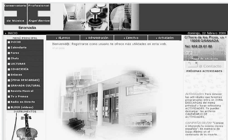
Portada de la web del conservatorio Ángel Barrios.

Además de la información reseñada incorpora calendarios de actividades y varias encuestas. También banners de músicos y pinacoteca, así como buscador interno y una amplia relación de enlaces de interés informativo y didáctico. Igualmente incluye un sitio de descargas con la normativa vigente, así