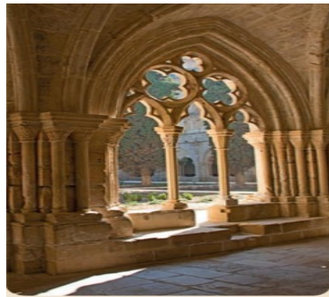
Arco ojival o apuntado. (gótico)

Las columnas. Aguantan el peso de los edificios. Tienen 3 partes: basa (A) , fuste (B) y capitel ( C)