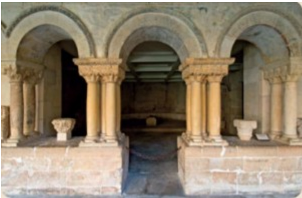
Arco de medio punto (románico)

Los arcos. Cubren un espacio entre dos paredes o columnas.