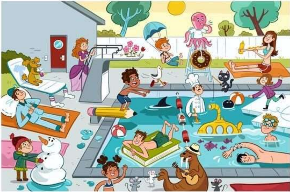
Silly Swim Client: Highlights Puzziemania

Observa el dibujo e indica si está o no.